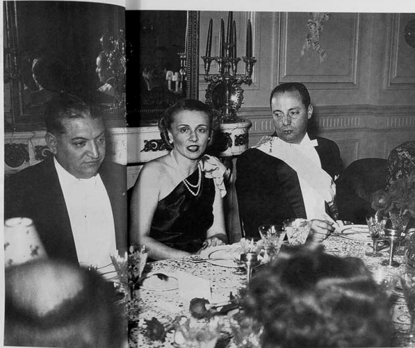
LUIS BATLLE EN UNA CENA DE GALA