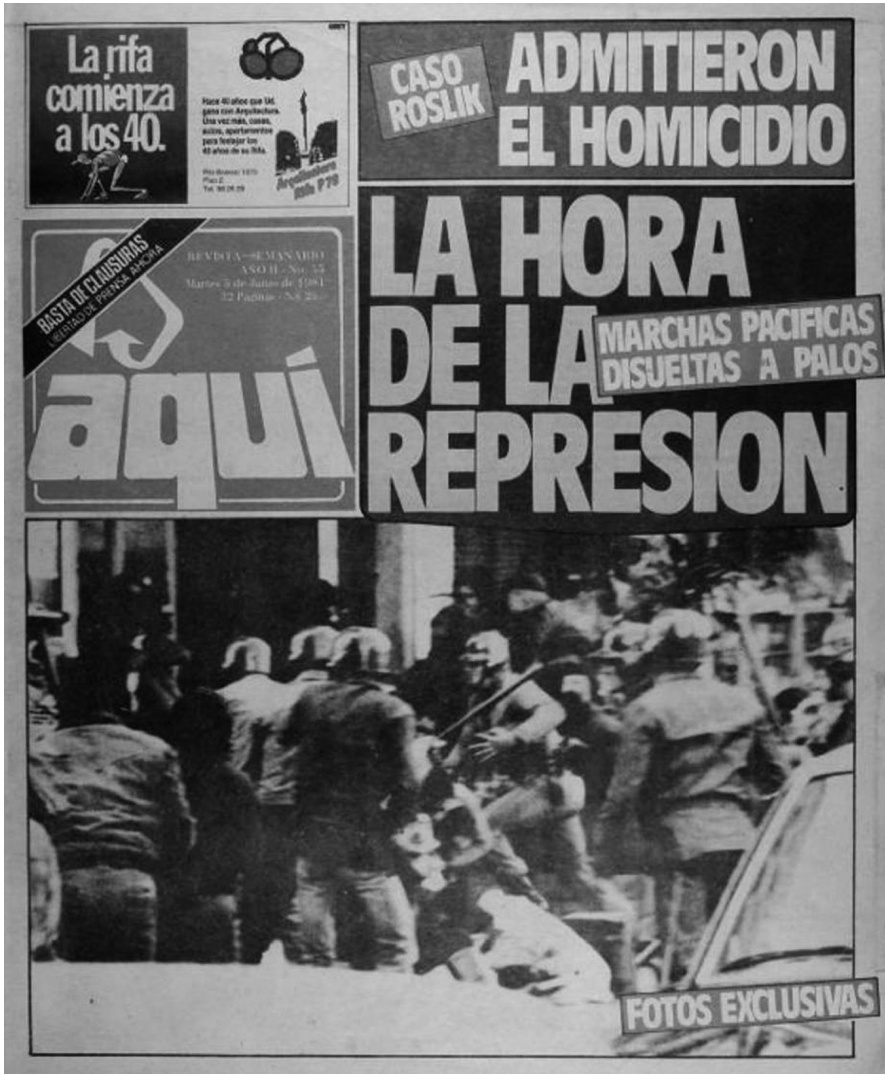
Portada e interior de diario Aquí, 5 de junio de 1984.

A su vez, la descontextualización y el uso arbitrario de las imágenes suelen ser características inherentes de las historias gráficas, nombre que alude a las series fasciculares ilustradas, construidas a modo de crónicas y compuestas por gran cantidad de imágenes, por lo general concebidas como emprendimientos comerciales desarrollados al margen de los centros de producción de conocimiento histórico e investigación. En ellas la función de las imágenes consiste en ilustrar textos que han sido escritos