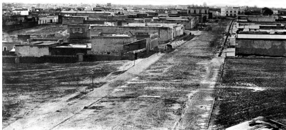
[Imagen 2] Plaza Cagancha antes de iniciarse la construcción de la “Columna de la Paz”. Año 1865. Reproducción posterior. (Foto 23B/ Centro de Fotografía de Montevideo).