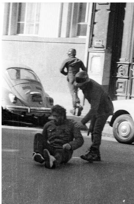
Represión de una manifestación antidictatorial. 4 de junio de 1984.

En este caso, una vez más, podemos resolver el misterio que rodea a las fotografías en cuestión. La mayor parte de los fotogramas analizados fueron publicados en el diario Aquí el 5 de junio de 1984 en calidad de testimonio de la brutal represión ocurrida el día anterior durante una marcha antidictatorial en las inmediaciones de la Universidad de la República. Una de las fotografías, en la que miembros del cuerpo de Granaderos avanzan con vehemencia a pesar de la presencia de una persona caída, fue portada de la edición con el siguiente titular “ La hora de la represión. Marchas pacíficas disueltas a palos ”. También en tapa se anuncia la publicación de “ fotos exclusivas ”, lo cual alude a la inusual aparición en la prensa de la época de este tipo de registros gráficos que, por otra parte, suponían un riesgo para sus autores y editores que, como puede